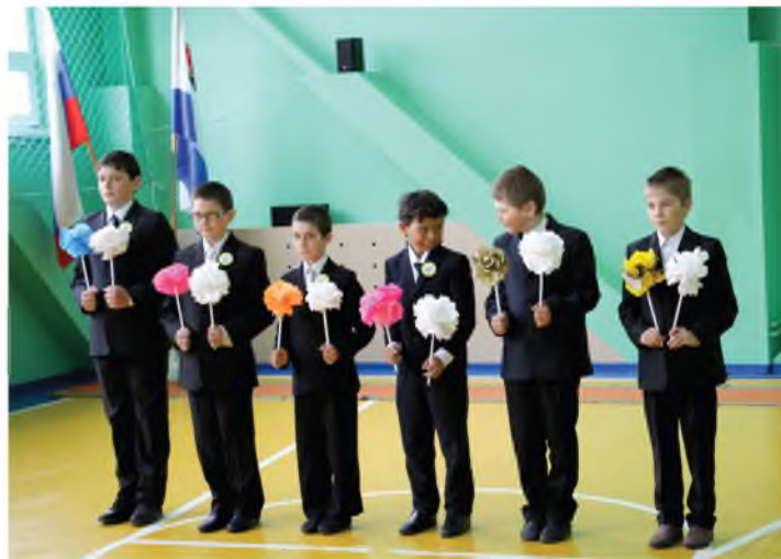
Мужественный коллектив будущего 5 класса

ти, это еще один «кадетский» класс) пока за работу оценок не получают, а вот остальные 84 ученика свои результаты видят в дневниках. Из них 15 человек в колонке отметок за год имеют только отличные оценки, а еще 31 ученик может похвалиться учебой только на 4 и 5.