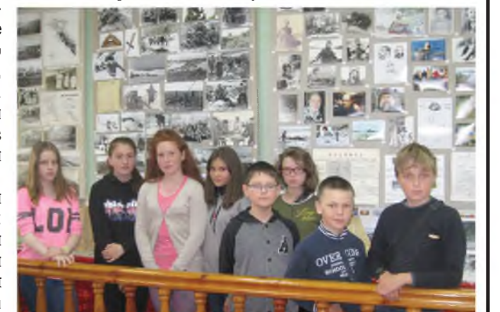
Юные волонтеры Алеутского краеведческого музея