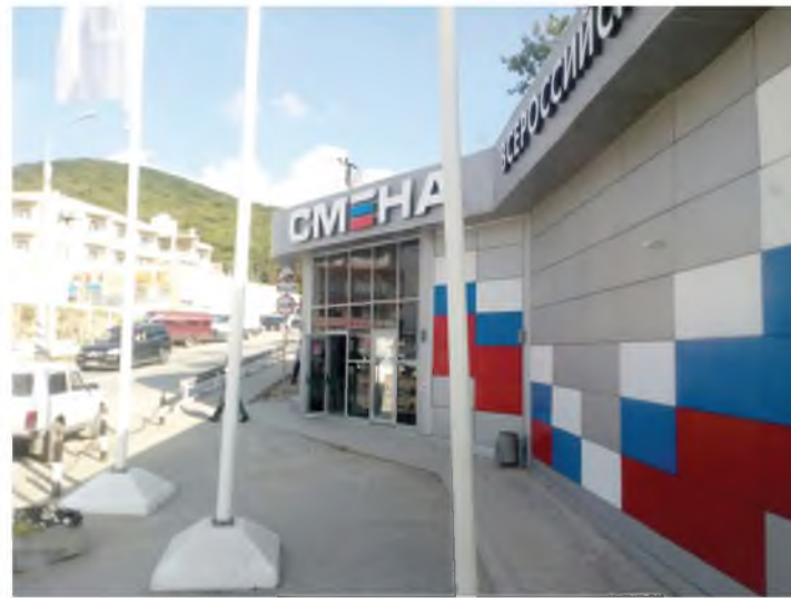
был ближе всех к выезду, и получилось, что мы провожали почти всех участников.

В последний день смены все пошли к морю, взявшись за руки, а потом собрались у большого костра. Было грустно расставаться с новыми друзьями, и многие плакали. Наш коттедж